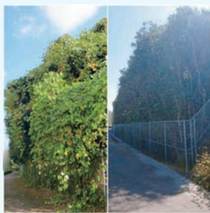
市が洞小学校の植栽剪定