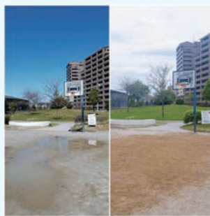
鴨田公園 バスケットゴール前の整備