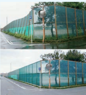
南中学校のフェンスの修理

地域や校区に捉われず、市内全域を地元として、市民の皆様から頂いたお声を行政に届けています。