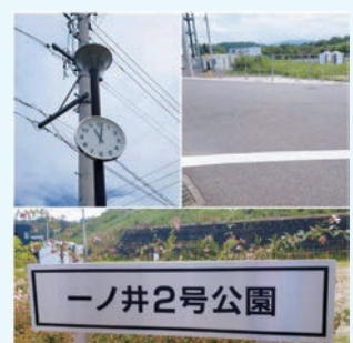
公園の時計設置 道路の停止線を整備