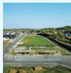
< スーパー出店予定地 >