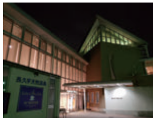
〈ござらっせ・あぐりん村は指定管理が外れると最短でも1年は休館になる可能性があります〉

この議決以後が私の賛成した指定管理期間となりますので厳しい目をもって見ていくことを覚悟し、また、農産者始め市民の生活や生きがいを守る自民党の議員、長久手市の温故知新、継往開来、不易流行を重んずる政治を行うことが保守系議員の本分であり、長久手の市民や市外からのお客様の笑顔を守るために選ばれた議員として、長久手生まれ長久手育ち、故郷長久手を愛する議員として、 私は賛成○とさせて頂きました。